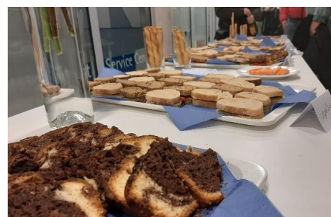
Till Seifert, 7b